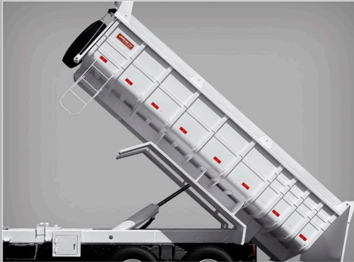
EQUIPAMENTO EM FUNCIONAMENTO

Imagens ilustrativas. O fabricante reserva o direito de alterar e modificar seus produtos sem prévio aviso.