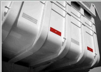
REFORÇOS ESTRUTURAIS TIPO COSTELA