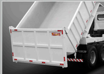
ABERTURA DE TAMPA TRASEIRA