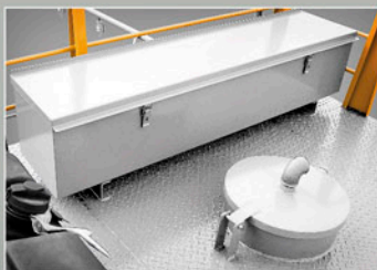
CAIXA SUPERIOR PARA FERRAMENTAS