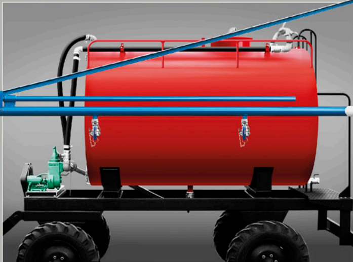
CARRETA (USO EXCLUSIVO AGRÍCOLA)