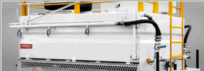
ESTRUTURA COM SAÍDAS LATERAIS E SAÍDA TRASEIRA POR GRAVIDADE