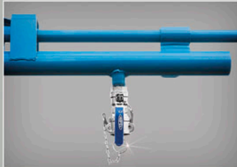
BRAÇOS ARTICULÁVEIS (PONTO DE APLICAÇÃO DE GEL)